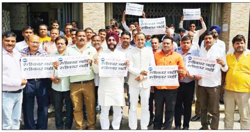
किदवाई नगर मार्बल मार्केट पर प्रदर्शन करते भारतीय उद्योग व्यापार मंडल के पदाधिकारी।

कानपुर (एसएनबी)। जीएसटी के सर्वे को लेकर मंगलवार को भारतीय उद्योग व्यापार मण्डल के बैनर तले व्यापारियों की बैठक किरदवाई नगर मार्बल मार्केट में आयोजित की गयी। व्यापारियों ने सर्वे के आदेश को बाजारों में भय का माहौल बनाने वाला बताया। साथ ही बैठक में टॉस्क फोर्स का गठन किया गया। जो कि सर्वे का विरोध करेगी।