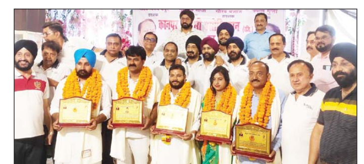
केवीए द्वारा सम्मानित किए गए नवनिर्वाचित पार्षद व संस्था के पदाधिकारी