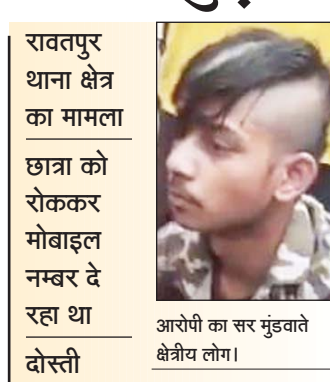
आरोपी का सर मुड़वाते क्षेत्रीय लोग।

कानपुर (एसएनबी)। रावतपुर क्षेत्र में स्कूल जा रही छात्रा का हाथ पकड़कर उसे मोबाइल नम्बर देने का प्रयास कर रहे और खुद को हिन्दू बताकर दोस्ती का दबाव बना रहे एक युवक को भीड़ ने दबोच लिया। भीड़ को शोहदे के पास मिले आधार कार्ड से जब उसका असली नाम पता चला तो उसे जमकर पीटा और बीच सड़क बैठकर उसे गंजा कराने के बाद पुलिस के हवाले कर दिया। पुलिस ने जब पता चला कि छात्रा की ओर से तहरीर मिलने पर उसके आधार पर रिपोर्ट दर्ज कर कार्रवाई की जायेगी।