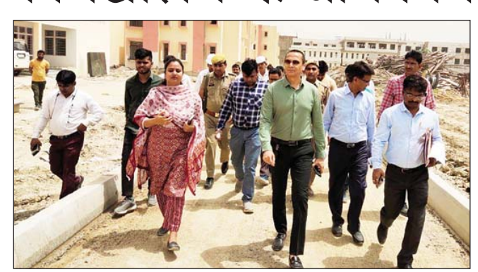
बिल्हौर तहसील में निर्माणाधीन अटल आवासीय विद्यालय का निरीक्षण करते मंडलायुक्त।

कानपुर (एसएनबी)। मंडलायुक्त ने बिल्हौर तहसील के ग्राम रामपुर नरुआ में निर्माणाधीन अटल आवासीय विद्यालय का निरीक्षण कर धीमी कार्य प्रगति पर नाराजगी जताई। उन्होंने कहा कि सभी कार्य माइक्रो प्लान के अनुसार नियत तिथियों के भीतर पूर्ण कराए जाएं, जिससे जुलाई से प्रारम्भ होने वाले शैक्षणिक सत्र में कक्षा-6 में 80 बच्चों (40 छात्र एवं 40 छात्राएं) को प्रवेशित कराकर विद्यालय प्रारम्भ कराया जा सके।